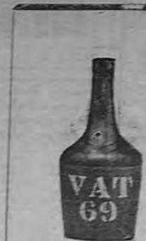
Extracto del "War Office Times and Naval Review"

Viene de la página PRIMERA Definición al segundo punto que trata, el cual se refiere a la prolongación de la moratoria de los acreedores de los Bancos del Estado, y en consecuencia, exterior en opinión la cual mantengo. De los Bancos del Estado, no están todos en condiciones de prolongar la moratoria, y en cuanto al Banco Internacional solamente al que de decir el cuál en condiciones de hacerlo o no. Ahora bien: me parece buena la idea como ya lo manifesté, pero creo que debería ser una prolongación de moratoria completa en todo el Estado. El sistema Internacional puede hacer un estado de cada caso, y aplicar el sistema de moratoria de la moratoria. Más particularmente, y de otras soluciones que de cada caso. La exposición de otras formas requerirá largo espacio para la cual hay que hacer un estudio previo. En referencia al tercer punto, que es bajar el tipo de interés, obligando a los Bancos particulares por medio de un impuesto, creo que en el fondo es una buena idea. Mejor dicho: la idea tiene buena intención, pero busca nada más que la protección del pequeño industrial que trabaja con capital tomado a interés, pero me temo que los resultados de esta medida no respondan a lo que deseamos. En principio puede suponerse. En caso de que a los Bancos se les obligue a fijar más barato el tipo de interés, disminuirían éstos un impuesto, pagarían