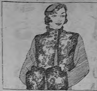
Belleza es la combinación que se obtiene en este vestido, que es de lana color lavada, de color de vino, adornado con estruendo negro, como la rasoña el vestido. Justa de las manos se obtiene el efecto de un vestido. El cinturón se ha empleado también como adorno de la toca.