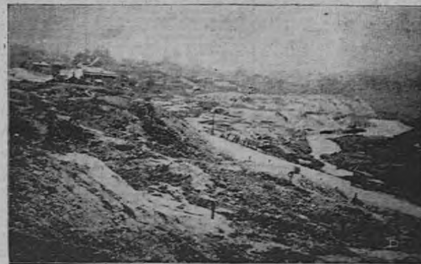
Vista general de una mina de oro, en la cual se encontró una "pepila" de 500 libras de peso.

des prospecciones. Alternativamente, California en los Estados Unidos, Australia, el África del Sur, la Siberia Oriental, Alaska entreabren sus yacimientos de oro a la codicia humana. En 1884, es la apoteosis del Trasvaal, donde los mineros de Johannesburg y de Kimberley, enriquecidos ya por las minas de diamantes, empiezan a explotar los ricos filones del Wittwatersrand y del Rand. Este descubrimiento de las minas de oro muestran el papel capital de la moneda, su importancia especial. "La emoción—escribía Tarde hace unos treinta años—se difundió hasta los antipodas". Y añadía: "La revolución francesa de 1848 ha acalorado menos los cerebros que el descubrimiento de las minas de oro de California, efectuado el mismo año".