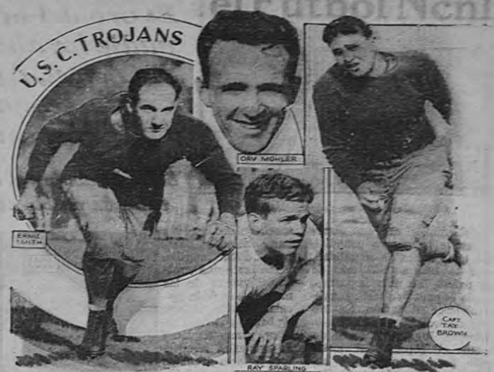
Algunos de las estrellas futbolísticas del sur, pertenecientes al equipo de Los Trojanos, del sur de California.

Federación dispuso en forma definitiva, concederle a la Liga Deportiva Alajuelense el cuarto juego de la temporada internacional con los argentinos. Así se resuelve, de una vez por todas, la incertidumbre que rodea