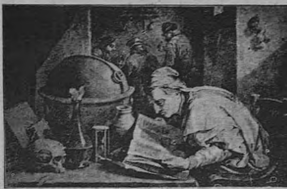
"El doctor Alquimista", según su descripción original de David Timers.

Sólo el trabajo y el ahorro, ha dicho Laval, son las virtudes que le permiten a un pueblo conservar el oro, única base de la finanza moderna