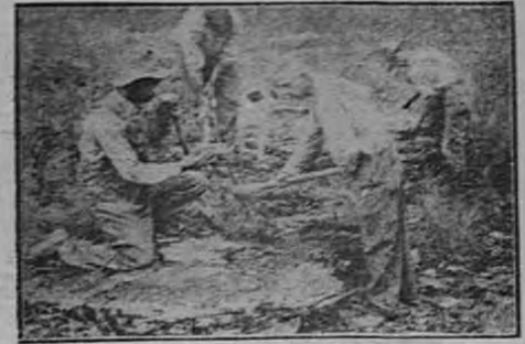
En un establecimiento inglés de laminación de oro: los trabajadores de oro

El oro de las minas sirve, pues, sobre todo para batir moneda, y las reservas de oro amonedado o en lingotes aumentan sin cesar en el mundo. En 1900, los stocks monetarios totales de todos los países alcanzaron una cifra de 22 millones de millones de francos en oro, para una población total de 1537 millones de habitantes. A la declaración de guerra, en 1914, el encaje en oro de todos los bancos de