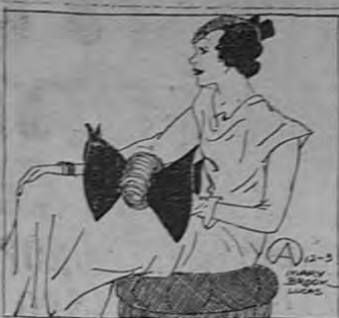
Sigue siendo un detalle interesante la grama de tela o adorno en el mangüito y el sombrero. El vestido muestra un detalle de lana color de vino, con un detalle de lana color de vino. Este por de adorno luce extraordinariamente sobre un abrigo largo y angosto de lana.