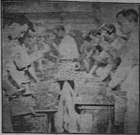
Algunos buscadores en plena actividad.

El problema del oro, tan discutido durante la guerra mundial, es más que nunca de actualidad. Aunque de 1924 a 1930 más de veinte países, los más importantes desde el punto de vista comercial, volvieron al patrón de oro tras los desórdenes monetarios de la inflación, Inglaterra acaba de abandonar el soporte del metal amarillo para su moneda, y varios países europeos la han imitado. Desde aquel instante, es decir, desde el 21 de septiembre último, estamos asistiendo a una verdadera redistribución del oro depositado en los grandes bancos de emisión, movimiento que comenzó a principios de 1931, pero que ha cobrado, en estos últimos meses, una extraordinaria amplitud, sobre todo debido a las corrientes de exportación del oro de los Estados Unidos con rumbo a Europa.